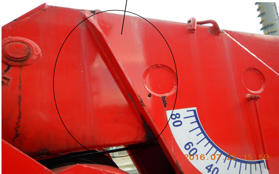
起伏油壓缸固定架與伸臂第一節腹板結合處(駕駛側)銲道裂痕。